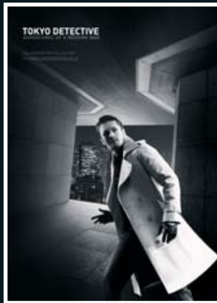
KAMPAŇ PRO JAPONSKÉHO MÓDNIHO NÁVRHÁŘE

tak, aby celá scéna evokovala odpolední odpočinek u šálku horké čokolády. Přivezli jsme si starožitnou kovovou lavičku, modelku oblékli do odpovídajících šatů a do rukou jí dali šálek s horkou čokoládou. Světlo na fotografii pochází ze dvou zdrojů: prvním je zapadající slunce, které krásně prosvětluje vlnící-se trávu za modelkou a les a vytváří celou atmosféru snímku. Kdybychom použili jen čistě denní světlo, modelka by měla v obličejích tmou, což nebylo žádoucí - doplnili jsme tedy daylight i zábleskem - záblesková hlava Profoto, připojená na bateriový generátor Profoto Pro-B2 s nasazeným Octaboxem, namířená zprava zeshora na obličej modelky. Ve postprodukční fázi jsme ještě posílili atmosféru několi-