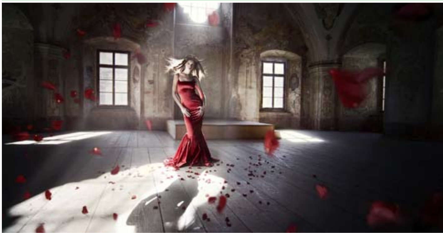
TITULNÍ FOTOGRAFIE KE KOLEKCI ŠATŮ NÁVRHÁŘY HELENY MERTLOVÉ. FOCENO V KLÁŠTĚŘE CHOTĚJOV

Fotografie je součástí módní story pro valentýnské číslo časopisu Marianne bydlení. Atmosféra celého příběhu je inspirovaná barokními malíři, kteří využívali techniku šerosvitu či temnosvitu, to znamená, že celý obraz je utopený ve tmě a pouze část, na kterou chceme upozornit je zvýrazněna světlem. Další, čím se tato díla vyznačují bývají velmi dramatické mraky a divoké krajinné scenérie. Fotili jsme kousek za Prahou, ve Štěchovicích, na břehu Vltavy (některé z fotografií pak i přímo ve Vltavě). Na této fotografii je modelka napózovaná