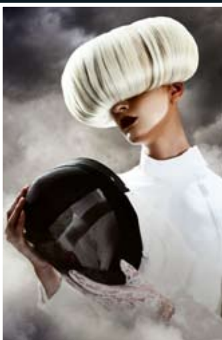
FOTOGRAFIE DO KADEŘICKÉ SOUTĚŽE PRO SALON PETRY MĚHUROVÉ

Prozradíte nám, jak jste fotografoval snímek dívky s kávou? Co bylo záměrem a jak jste provedl následné úpravy snímku?