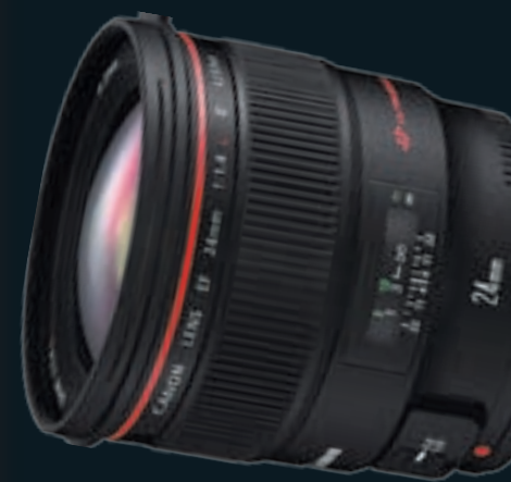
FOTOGRAFIE DO KADEŘICKÉ SOUTĚŽE PRO SALON PETRY MĚHUROVÉ

ka úpravami: vytáhli jsme při vyvolávání z RAWu nebe, které bylo přexponované, zvýraznili záři zapadajícího slunce za stromy a nakonec celou fotografii tónovali do zlato-fialových odstínů. Na mých stránkách najdete celou story i video z jejího focení.