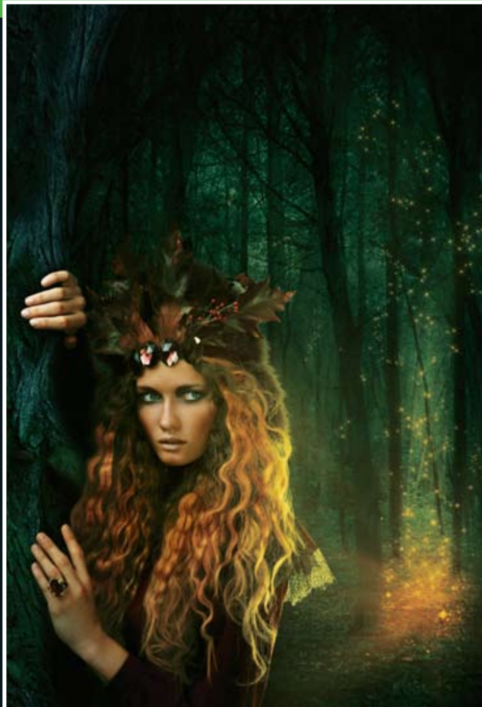
FOTKA Z POKÁDKOVÉ MÓDNÍ STORY PRO HARPER'S BAZAAR, O HOLČICE PUTUJÍCÍ KOUZELNÝM LESEM ZA SVĚLEM

To záleží. Mám kolem sebe tým velmi schopných lidí, který se o tyto věci stará a obecně věřím, že cokoliv mne napadne, je možné i zrealizovat. Zatím se to vždy povedlo, takže se nenechávám omezovat myšlenkami na to, že něco je nemožné. Většina věcí (i když to zpočátku působí nepravděpodobně) se dá dohodnout či zapůjčit zdarma či za minimální částky, když dokážete strhnout lidi svými nápady a vizí natolik, aby s vámi chtěli spolupracovat. Pak existuje ještě několik oblíbených zdrojů rekvizit - ať už Barrandovský fundus nebo různé bazary či bazary nábytku, kde vám půjčí vcelku cokoliv za směšný peníz.